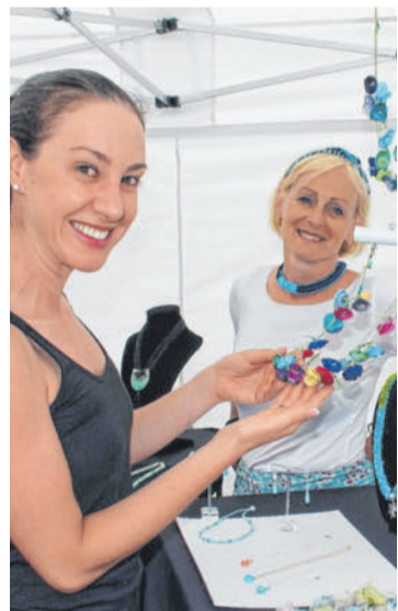
Das Harder Seeufer wird am Wochenende zur Bühne für Kunsthandwerk. BMS

HARD Hard wird wieder zur Bühne des Kunsthandwerks. Die Töpferei Güttinger aus Isny als Veranstalter lädt am Samstag, 7. Mai, von 10 bis 18 Uhr, und am Sonntag, 8. Mai, von 11 bis 17 Uhr zu ihrem schon traditionellen „Kunstmarkt“ an den Bodensee. Über 40 Künstler aus ganz Deutschland präsentieren auf dem Festplatz am See an ihren dekorativ gestalteten Ständen außergewöhnliche Produkte und kreative Accessoires, alles handgefertigte Stücke aus den eigenen Werkstätten. Mit dabei sind wieder Töpfer, Schmuckhersteller, Handwerker und ein Besenbinder, dazu gibt es Edles aus Walk, Textilien, Gemälde sowie Unikate aus Holz, Stein, Metall, Silber oder Keramik. Der Kunstmarkt findet bei jeder Witterung statt. Der Eintritt ist frei. BMS