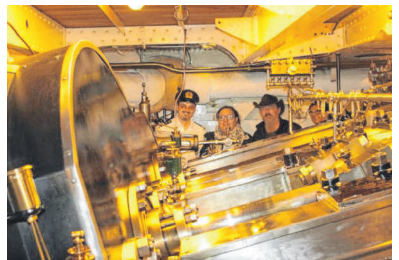
Hinter die Kulissen – sprich: in den Maschinenraum – können die Gäste beim Tag der offenen Tür von Hohentwiel und Oesterreich blicken.

angeboten. Die Gelegenheit, sich „im Bauch“ der Schiffe umsehen zu können, ist besonders auf dem Dampfer ein eindrucksvolles Erlebnis.