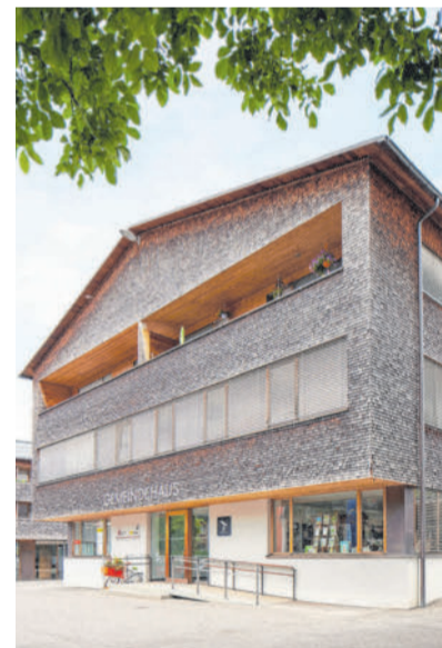
Ein Projekt war die energetische Sanierung des Krumbacher Gemeindehauses.

Krumbach ist das e5-Team derzeit in einer Umstrukturierungsphase und sucht neue Mitglieder, die mit guten Ideen die Energiepolitik der