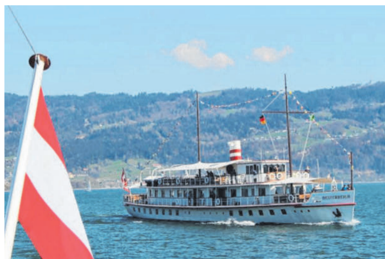
Auch Rundfahrten mit den beiden historischen Schiffen werden bei der traditionellen Veranstaltung, die heuer am Muttertag stattfindet, angeboten.

Am kommenden Sonntag, 8. Mai, gibt es von 10 bis 17 Uhr nicht nur Gelegenheit, die beiden Schiffsjuwelen, die zwei Epochen verkörpern,