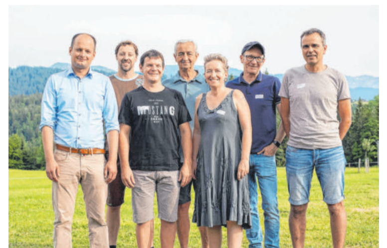
Das e5-Team in Krumbach sucht kreative Köpfe, die sich für Themen rund ums Klima und die Umwelt einsetzen möchten.

KRUMBACH Die ersten Projekte als e5-Gemeinde, die Krumbach in Angriff nahm und die bereits abgeschlossen sind, waren die energetische Sanierung der Gemeindegebäude, die Errichtung eines durch eine Biomasseheizung gespeisten Nahwärmenetzes, das Projekt „Junger Wald“, eine Initiative zur nachhaltigen Waldbewirtschaftung, und die Einführung einer Energiebuchhaltung. Dabei handelt es sich um eine periodische Erfassung einer Vielzahl von Energiemessstellen (Wasser, Strom, Wärme). So konnten unentdeckte und nicht benötigte Verbraucher identifiziert und der Energieverbrauch spürbar reduziert werden.