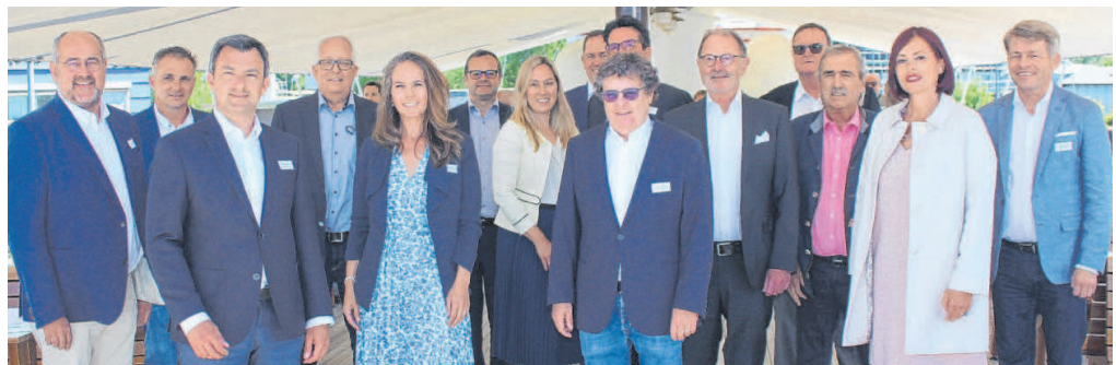
Ein Großaufgebot hat an Bord der Oesterreich das umfangreiche Vertragswerk für die „Historische Schifffahrt Bodensee GmbH“ unterfertigt.

Kern dieses umfangreichen Vertragswerks: Bisherige Mehrheitsverhältnisse wurden grundlegend verschoben. Seit der Indienstellung 1990 wurde der originalgetreu restaurierte Raddampfer Hohentwiel – im Eigentum des 1984 gegründeten Vereins Internationales Bodensee-Schifffahrtsmuseum – von einer Gesellschaft betrieben, an der die Gemeinde Hard mit 75,2 und der Verein mit 24,8 Prozent be-