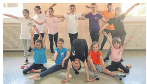
Nach der Coronapause machte den Kindern und Jugendlichen ein gemeinsamer Workshop mit Bewegung und Tanz wieder sichtlich großen Spaß.